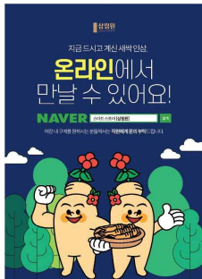
새싹인삼 관련 포스터, X배너 부착