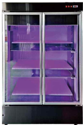
새싹인삼 중형 재배기