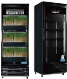
새싹인삼 소형 재배기