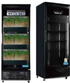
새싹인삼 소형 재배기

가정, 음식점, 사무실 등 3평 이상의 작은 빈 공간을 활용하여 프리미엄 약용 작물을 무농약, 친환경 기계식 농법으로 재배해 누구나 쉽게 소득을 창출할 수 있는 도시형 농업 사업입니다.